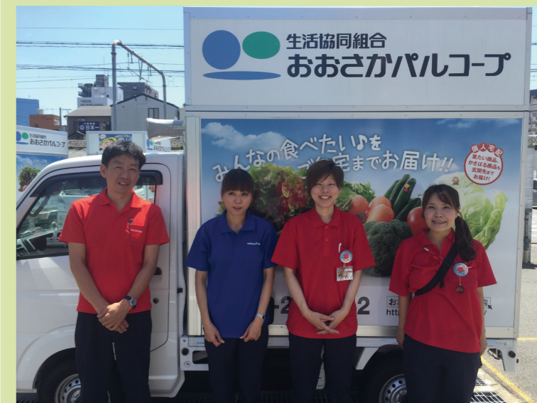
組合員が密集する地域で活躍するルートメイト（配送パート職員）。

第15回 おおさかパルコープ 地域に合った事業と職員が働き続けられる 環境を構築する「共同購入改革」