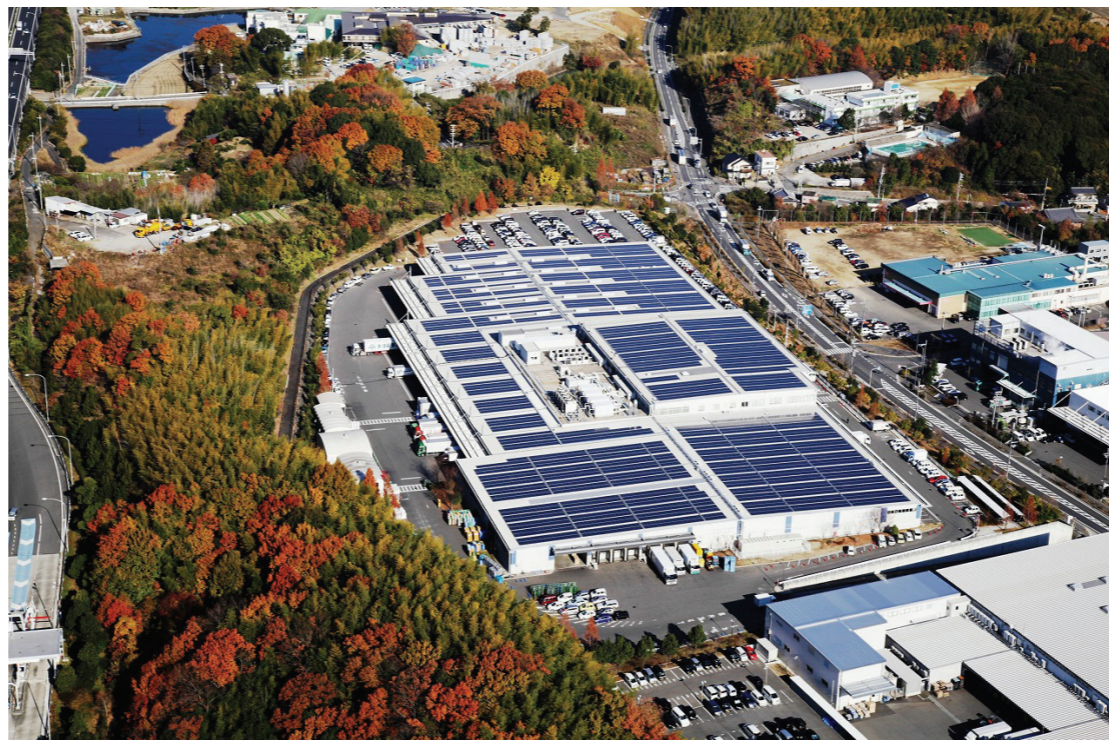
大阪いずみ市民生協の物流センターの屋上に設置されたメガソーラー。 この発電施設は、組合員向けの電気小売事業「コープでんき」の電源になっている。