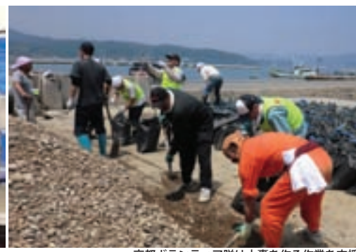
京都ボランティア隊は土嚢を作る作業を支援