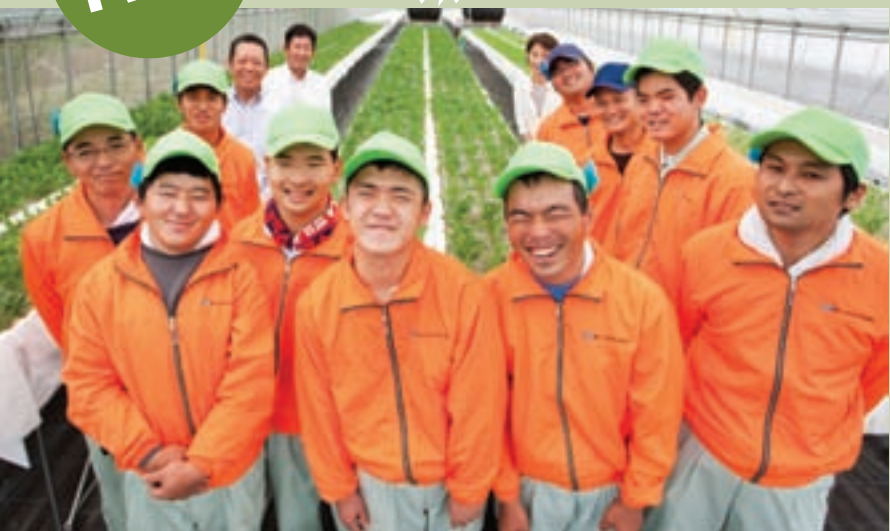
（編）ハートランドひろしまの皆さん