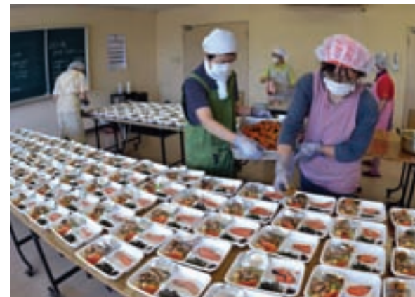
いわて生協のお弁当作りボランティア