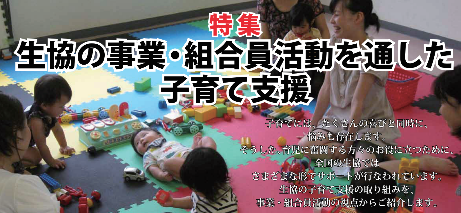
コープやまぐちの子育てひろば

子育てには、たくさんの喜びと同時に、 悩みも存在します。 そうした、育児に奮闘する方々のお役に立つために、 全国の生協では さまざまな形でサポートが行なわれています。 生協の子育て支援の取り組みを、 事業・組合員活動の視点からご紹介します。