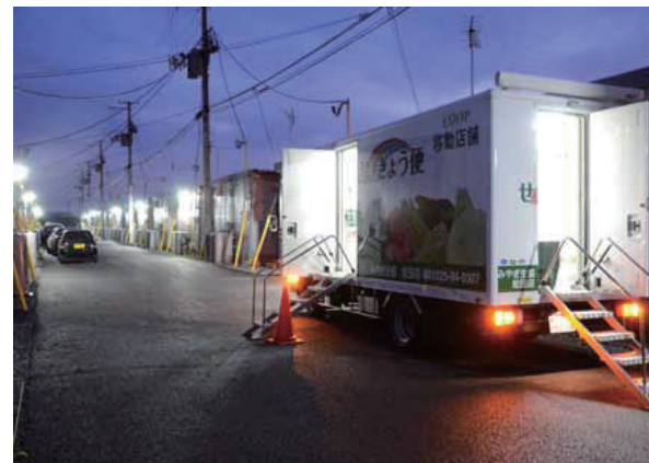
仮設住宅などを巡回する、みやぎ生協の移動店舗「せいきょう便」