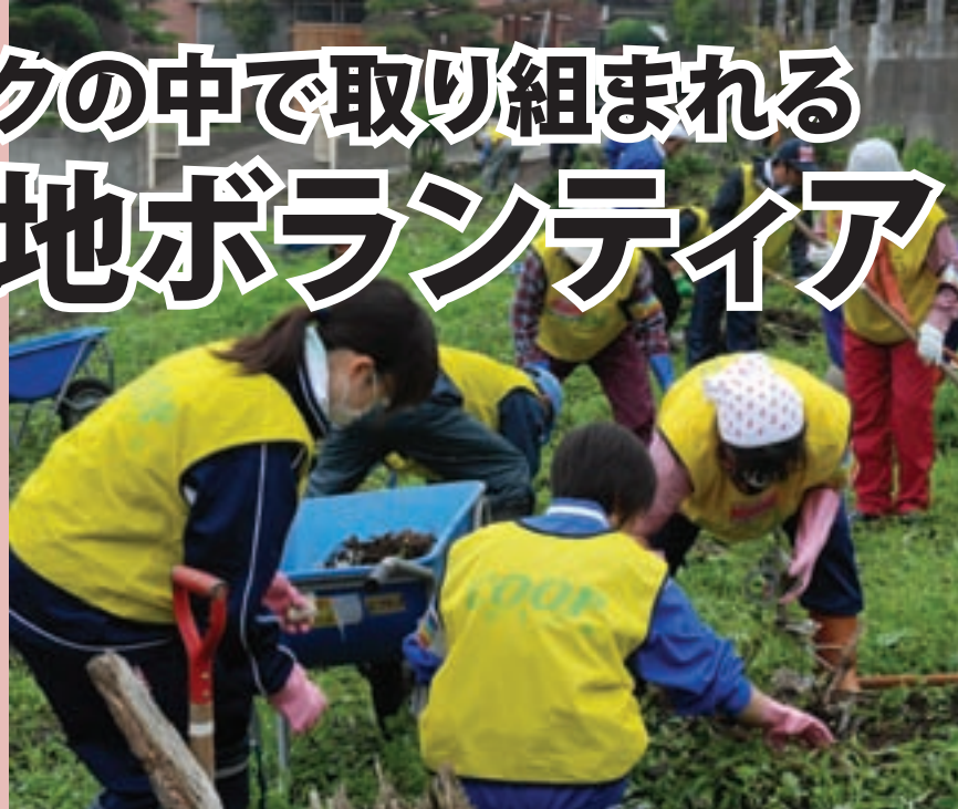
畑のがれきを片付けるいわて生協 CVC（コープ・ボランティアセンター）のボランティア参加者たち

生協は大震災からの復興を目指し、他団体とのネットワークの中で被災地ボランティアに取り組んでいます。今月号では、その活動の様子について報告するとともに、被災地で今、何が必要とされているか？を見据えた協力を呼び掛けます。