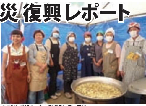
炊き出しを行なった山形ボランティア隊