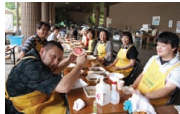
コープふくしまの炊き出しボランティアに参加した皆さん